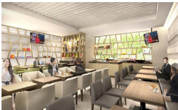
江戸の小路を思わせる 格子模様の壁を配置したラウンジ

建物は地上8階建て、ダブルとツインからなる全103室の客室で構成されており、朝食や飲料をご提供するラウンジをご用意いたしました。インテリアデザインには、ザ・ビバリーヒルトン（米国カリフォルニア州）、ル・メリディアンシカゴ（米国イリノイ州）、グランドハイアット仁川（韓国）、インディゴホテル（サウジアラビア）など数多くのホテルでデザインを手掛ける創業1965年の「ゲンスラー・アンド・