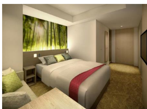
寛ぎを重視しソファを設置したスタンダードダブル（約18㎡）