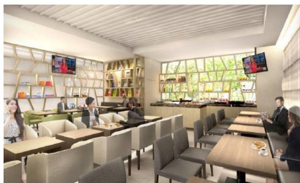
江戸の小路を思わせる格子模様の壁を配置したラウンジ