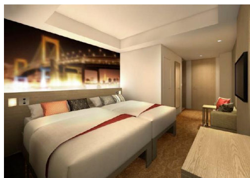
ベッド下にスーツケースが収納可能なハリウッドツイン（約20㎡）