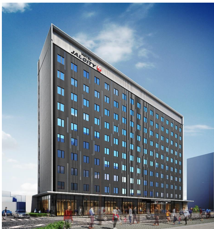
【ホテル JAL シティ富山 完成予想図】

本事業を推進するにあたり、西松建設株式会社と、同社が 100%出資し設立する株式会社西松ホテルマネジメントおよび株式会社オークラ ニッコー ホテルマネジメントの 3 社間で、本ホテルに関する運営管理契約を 6 月下旬に締結する予定です。