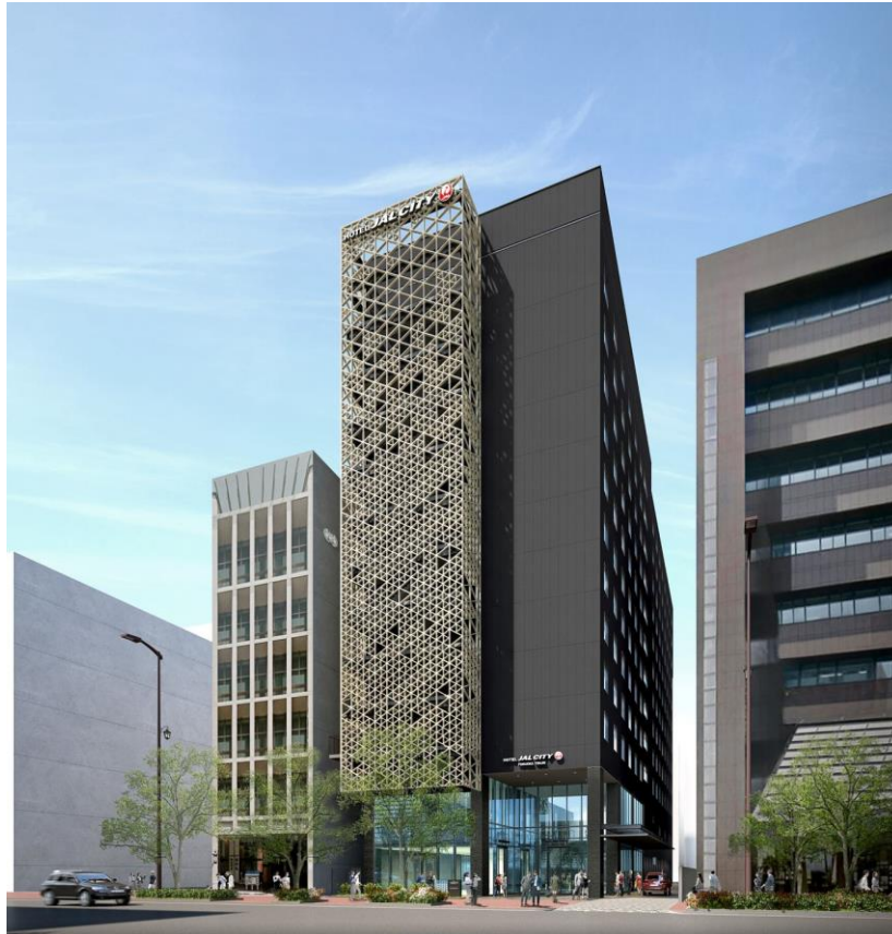
【『ホテル JAL シティ福岡 天神』完成予想図】

株式会社ホテルオークラの子会社でホテル運営会社である株式会社オークラ ニッコー ホテルマネジメント（本社：東京都港区、代表取締役社長：荻田 敏宏）は、2020 年 8 月 7 日付で、福岡天神ホテルマネジメント合同会社（所在地：東京都千代田区）をホテル経営会社として、『ホテル JAL シティ福岡 天神』（2021 年春の開業に向けて、現在、積水ハウス株式会社が開発を行っております）に関する運営管理業務を開始いたしました。